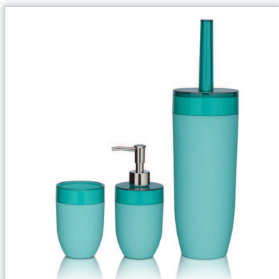
Sealskin, akcesoria Bloom. Gama akcesoriów łazienkowych w energetycznych, letnich kolorach: orzeźwiającej limonki, soczystej maliny oraz morską błękitu. W serii kubek, dozownik na mydło w płynie oraz szczotka WC. Dodatki wykonane są z wytrzymałego ABS, przy czym góra każdego elementu jest przezroczysta, a dół matowy.