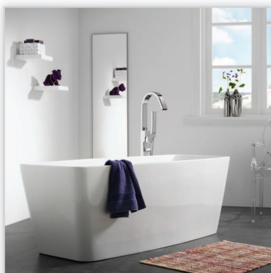
Sealskin, wolno stojąca wanna Note Square. Lekka stylistycznie, elegancka wanna o wymiarach 180/80/59 cm, pojemności 210 l oraz głębokości 43 cm. Wykonana z akrylu o grubości 4 mm. Cechą charakterystyczną wanny Note są cienkie ranty, co nadaje jej formie wizualnej lekkości. System odpływu wody jest w tym modelu dyskretnie ukryty pod dnem wanny.