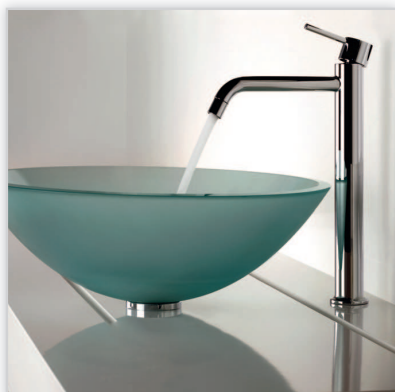
Guglielmi, bateria umywalkowa 29501. Klasyczna w formie armatura włoskiej marki Guglielmi. Model z przedłużonym korpusem stworzony z myślą o zastosowaniu do umywalk nabladowych. Proponowana w wykończeniu chromu oraz stali szlachetkowej. Klasyczny, uniwersalny design pozwala dopasować ją do umywalki w każdym stylu.