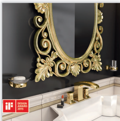
Geesa, akcesoria Tone NOWOŚĆ. Linia akcesoriów łazienkowych Tone, tegoroczna premiera marki Geesa, jest kolekcją jubileuszową, stworzoną na 130-lecie istnienia marki. Eleganckie dodatki o ponadczasowej formie przygotowane zostały w dwóch wykończeniach: chromu oraz złota. Nagrodzone prestiżowym wzorniczym tytułem iF Design Award 2015.