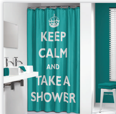
Sealskin, zasłona prysznicowa Testo. Zasłonka Testo niesie komunikat: łazienka to miejsce spokoju, a prysznic jest strefą relaksu. Całości tego przesłania dopełnia piękny szmaragdowy kolor zasłony, oraz eleganckie mocowanie tkaniny do montażu (metalowe pierścienie). Zasłonka Testo wykonana została z poliestru i ma standardowy rozmiar 180/200 cm.