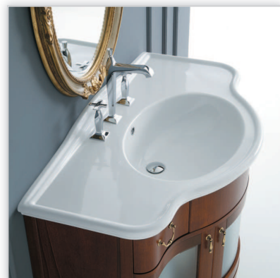
Disegno, ceramika Paolina. Kolekcja ceramiki sanitarnej włoskiej marki Disegno utrzymana w estetyce retro. W serii: stylizowane umywalki (pojedyncze i podwójne) do montażu na ozdobnych nóżkach, umywalki meblowe, umywalki-konsole oraz miska WC i bidet w wersji stojącej. Dwa rodzaje systemu spłukującego: tradycyjny ceramiczny zbiornik i gómpłuk.