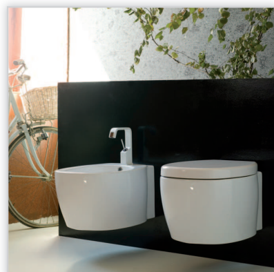
Disegno, ceramika sanitarna Tratto. Kolekcja ceramiki sanitarnej włoskiego producenta o owalnych, łagodnych kształtach. Dostępna w wersji stawianej i podwieszanej. W kolekcji umywalki wiszące/nabladowe o rozmiarze 60 i 70 cm (model z opcją postumentu), umywalka wpuszczana w blat 58,5 cm, miska WC, bidet, deski sedesowe, ceramiczna kolumna spłukująca.