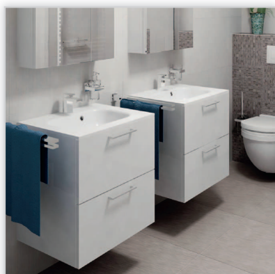
Tiger, meble łazienkowe Studio NOWOŚĆ. Minimalistyczne w formie meble z foliowanego MDF. Dostępne w wykończeniach: błyszczącej bieli, naturalnego dębu, dębu Chalet, oraz orzecha. Szafki podumywalkowe w wersji z pojedynczą umywalką 60 cm oraz 80 cm, z umywalką podwójną 120 cm oraz regał o wysokości 160 cm. W standardzie system cichego domykania.