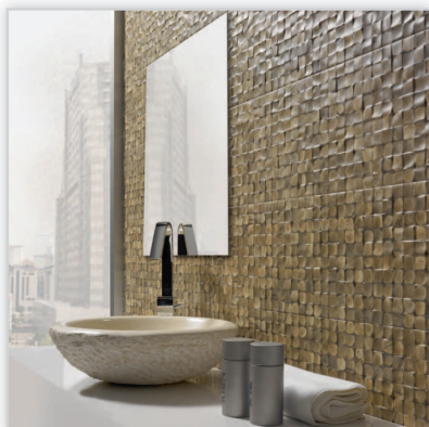
Aparici, płytki Coconut. Płytki ceramiczne hiszpańskiej marki Aparici, której firma Coram jest autoryzowanym dystrybutorem. Kolekcja ścienna, z wyrazistą fakturą „fusek” imitujących strukturę kory pnia drewna. Płytki w rozmiarze 25,1/75,6 cm dostępne są w dwóch wersjach kolorystycznych: White Focus oraz Brown Focus.